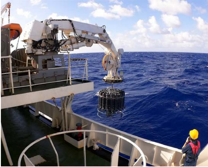
写真 1 : 水温や塩分の深度分布を連続的に測りながら、海水中の CO 2 濃度など様々な成分の測定に必要な海水を様々な水深から採取する CTD ロゼット採水システムを、観測船からクレーンで海中に下す（気象庁凌風丸）。