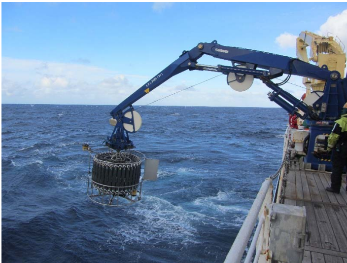
写真 2 : 海洋研究開発機構の海洋地球研究船「みらい」に搭載されている大型 CTD 採水システムを使用した観測の様子。