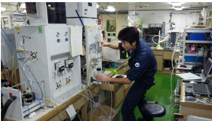
写真 3 : 様々な水深から採水した海水を、CO 2 ほか様々な成分について、高性能の分析機器を使って船上で速やかに分析する（気象庁凌風丸）。