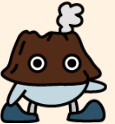
鹿児島地方気象台 マスコットキャラクター ぼるけん

ひとたび発生すると多くの災害を引き起こす火山噴火。このうち風によって流された火山灰は、大きな噴火になるほど、より遠くまで落下（降灰）して広範囲に影響を及ぼします。20世紀に発生した国内最大の桜島大正噴火から今年で100年。噴火に伴う降灰を予測する研究について紹介します。