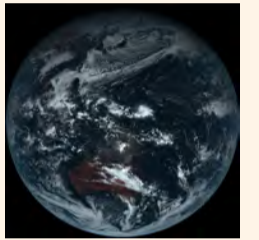
ひまわり8号 発画像

2014年10月7日に8代目の気象衛星ひまわりが打ち上げられ、本格的な観測が今年の夏に始まります。これまでよりも観測機能が大幅に拡充され、台風・豪雨・黄砂などをより正確に観測できるようになります。この新しいひまわりの機能や最新の観測事例についてご紹介します。